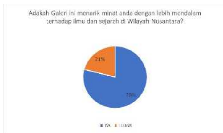
Rajah 4: Maklum balas terhadap keberkesanan galeri ini terhadap responden

Seperti semua sedia maklum, kebanyakan masyarakat kurang pendedahan terhadap ilmu dan sejarah di Wilayah Nusantara oleh kerana faktor penggunaan medium yang kurang menarik. Misalnya, sesetengah individu yang ingin mendalami ilmu dan Sejarah ini hanya boleh melayari laman sesawang yang tertentu dan pada akhirnya majoriti Masyarakat yang lain tidak mengendahkan ilmu ini kerana pendedahannya yang kurang meluas. Oleh itu, Universiti Teknologi Mara Cawangan Sarawak menubuhkan Galeri Islam Nusantara ini bagi menarik minat dan mempupuk semangat ingin tahu dalam diri Masyarakat. Tambahan pula, ianya ditubuhkan di kawasan yang strategik dan kondusif iaitu perpustakaan, dimana ianya menjadi tempat kunjungan semua pelajar dan juga pelawat- pelawat. Kebanyakan pelajar, pensyarah mahupun pelawat yang berada di perpustakaan tidak akan teragak-agak untuk berkunjung ke Galeri oleh kerana ilmu dan Sejarah di Wilayah Nusantara ini jarang untuk dijumpai dan merupakan sesuatu ilmu yang menarik bagi pengunjung. Oleh hal yang demikian, hasil tinjauan yang dilakukan mendapati sebanyak 79% responden menjawab ‘Ya’ manakala 21% menjawab ‘Tidak’. Ini membuktikan bahawa majoriti responden yang telah berkunjung bersetuju bahawa Galeri Islam Nusantara ini sememangnya menarik minat mereka dengan lebih mendalam terhadap ilmu dan Sejarah di Wilayah Nusantara.