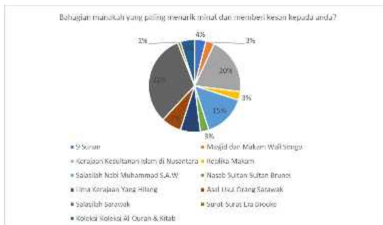
Rajah 3: Maklum balas terhadap bahagian-bahagian pameran