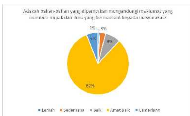
Rajah 1: Maklum balas terhadap bahan-bahan yang dipamerkan di Galeri Islam Nusantara UiTM Cawangan Sarawak

Adakah bahan-bahan yang dipamerkan mengandungi maklumat yang memberi impak dan ilmu yang bermanfaat kepada Masyarakat?