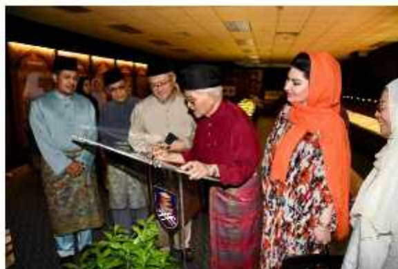
Gambar 1: Majlis Perasmian oleh Tuan Yang Terutama (TYT) Yang di-Pertua Negeri Sarawak Tun Pehin Sri Hj Abdul Taib Mahmud