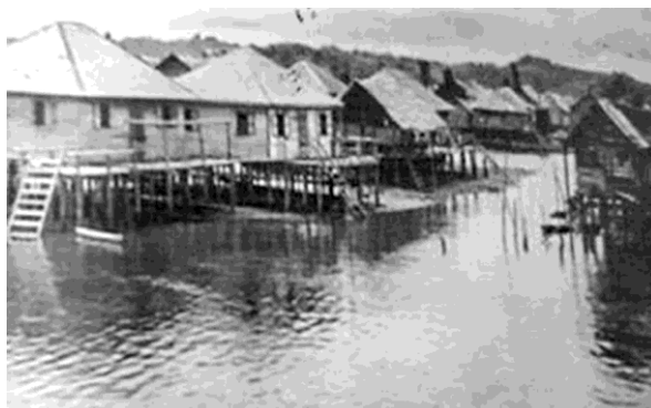
Pandangan Kampung Air pada tahun 1920-an