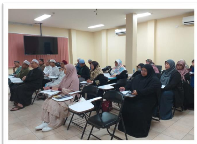
Program Talaqqi Kitab Turath Bagi Orang Awam, anjuran Pusat Penyelidikan Jawi dan Kitab Turath, KUPU SB