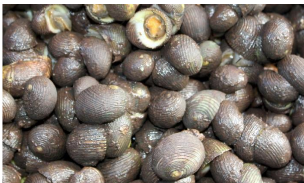
Siput atau 'takuyung'