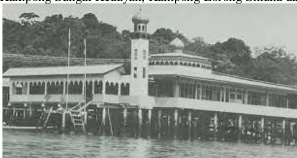
Balai Ibadat Kampung Setia di bangun pada tahun 1980-an