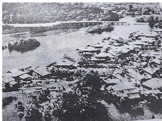
Kampung Sumbiling Lama, kampung Sumbiling Baru dan Jambatan Rangas pada tahun 1950