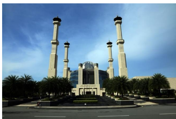
Balai Khazanah Islam Sultan Haji Hassanal Bolkiah