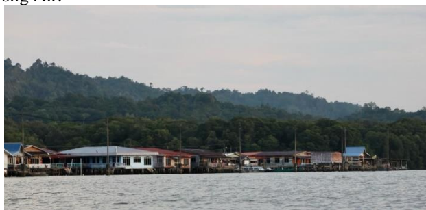
Kampong Burong Pinggai