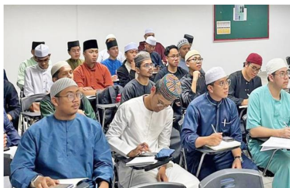
Program Balai Talaqqi Kitab Turath di UNISSA