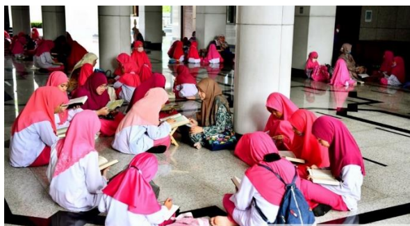
Sistem 'Beliun' (Halaqah)