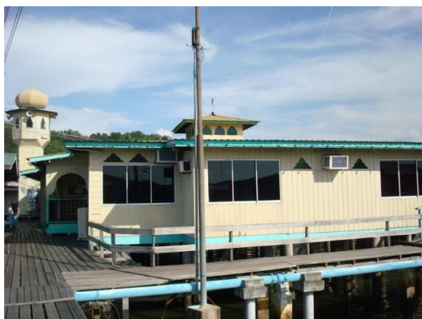
Balai Ibadat Kampung Saba

Asbol Mail, (2005) dan Haji Tassim, (2013) menyatakan bahawa sistem pengajian balai ini boleh dibahagikan kepada dua kateogri iaitu pengajian umum dan pengajian lanjutan: